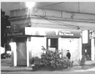
Avda. Manuel D. Rodríguez y Larriera Tel. 4342 1390

mi son todo, para mi las chiquilinas son espectaculares. Hasta las cosas más simples les preguntamos, y el vínculo que tenemos es de consultar en total confianza. Es un respaldo total. Ellos solucionan todo, nos dicen qué está correcto y qué no.