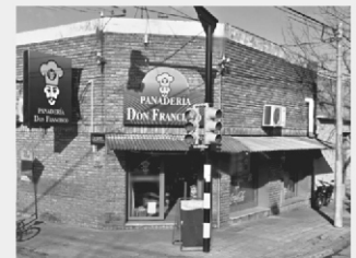
Sucursal: Herrera y Artigas Frente a Plaza 4 de Octubre